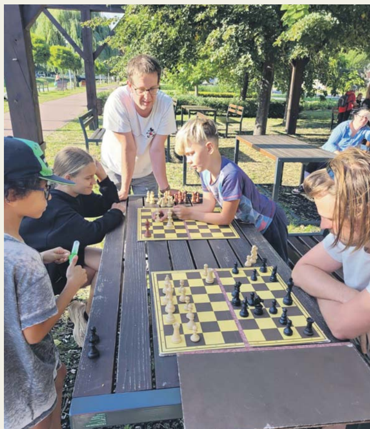
LATO W MIĘCIE ZAKOŃCZONE, A TAK BAWILIŚMY SIĘ W SIERPNIU Były szachy i flow stretching na bulwarach, zumba przy Będzin Arenie, treningi z Biegową Kuźnią, joga na placu przy bibliotece i cross na plaży miejskiej oraz grillowanie z masterchefami.