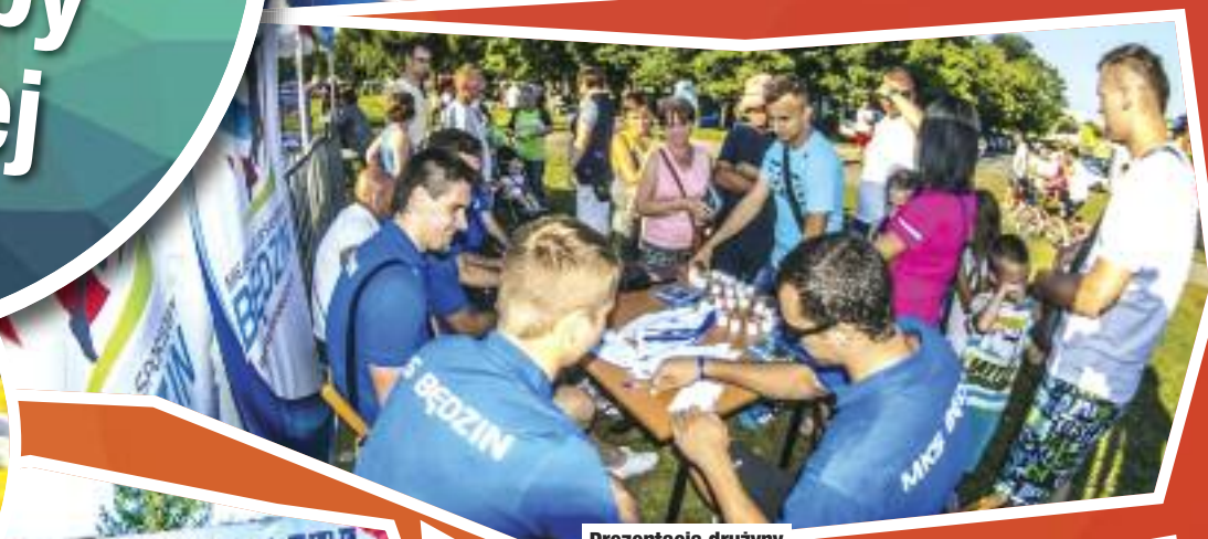
Prezentacja drużyny MKS Będzin