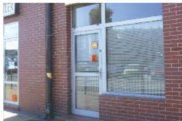
Ulica Kościuszki 2