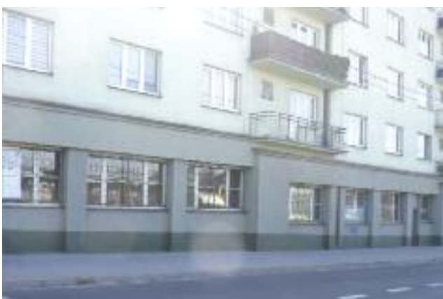
Ulica 1 Maja 2