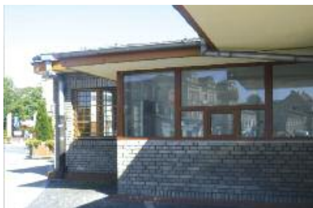
Plac Kolei Warszawsko-Wiedeńskiej 3