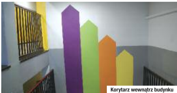
Korytarz wewnątrz budynku