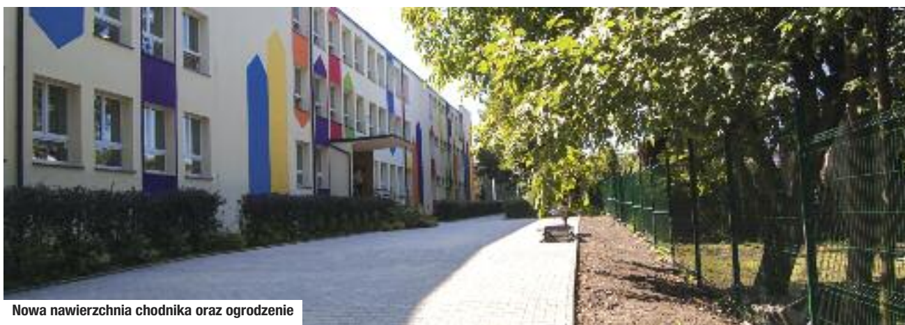
Nowa nawierzchnia chodnika oraz ogrodzenie