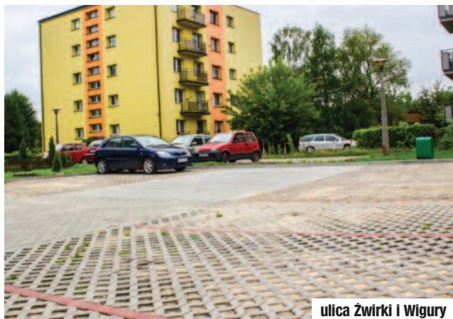
ulica Żwirki i Wigury