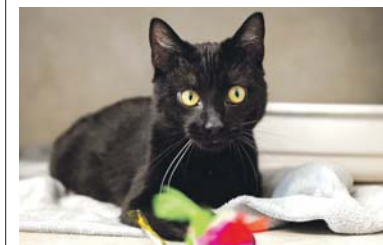
Bedeos 92/2026 ma rok i czeka na swojego człowieka od kwietnia.