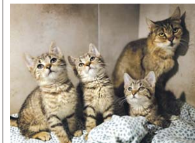
Cudowne maleństwa Botwinka i Selerek już mają nowy dom, ale czeka jeszcze maty Szczypiorek!