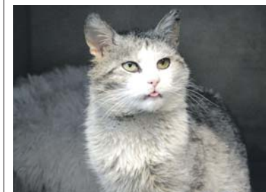
Wyjątkowy Migotek 88/2026 szuka kochającego domku na kolejne lata.