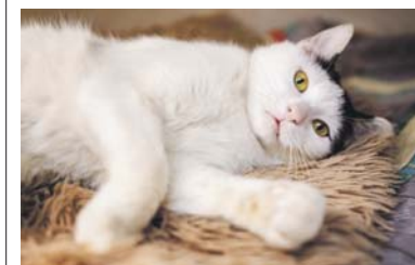
Procent 100/2026 – na 100 procent będzie wiernym towarzyszem.

Wiosna w petni, więc już do schronisk zaczynają trafiać niechciane kotki – czasem same, czasem z młodymi mamusiami. Jeśli ktoś może dać takim kocim dzieciom dom, choćby tymczasowy – warto zgłosić się do schroniska. Wszyscy natomiast pamiętajmy, że tylko kastracja i sterylizacja uchronić może setki kocich istnień przed śmiercią, która niestety czeka część bezdomnych zwierząt.