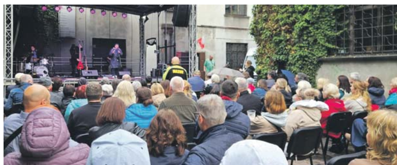
arc. Klubokawiarnia Stacja Arenda