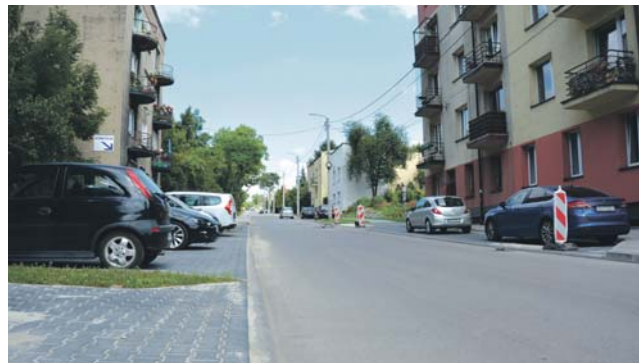
Remont obejmował m.in. wykonanie nowej nawierzchni jezdni, chodników, podjazdów pod posesje i miejsc postojowych w ciągu ulicy.

Kompleksowy remont ulicy św. Brata Alberta zbliża się do finału. Zakończenie wszystkich robót planowane jest na początek lipca