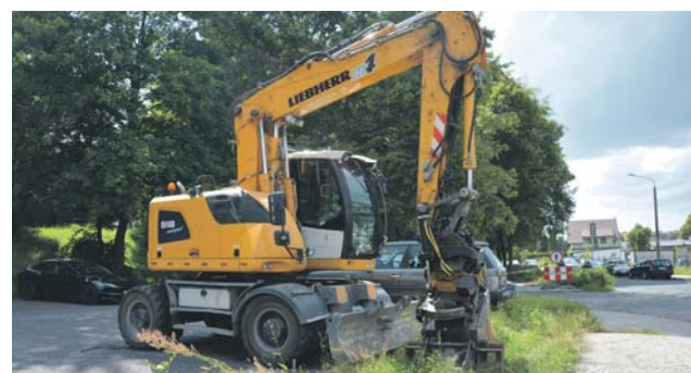
Przy ulicy Rzeszowskiej w okolicy Szkoły Podstawowej nr 2 na Zamkowym rusza pełna przebudowa drogi i chodników.

Kompleksowy remont ulicy św. Brata Alberta zbliża się do finału. Zakończenie wszystkich robót planowane jest na początek lipca