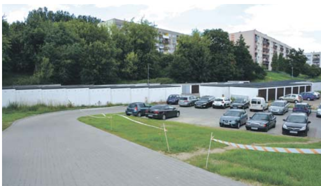
Przy ulicy Bilika na Syberce powstał parking wraz z dojazdem.