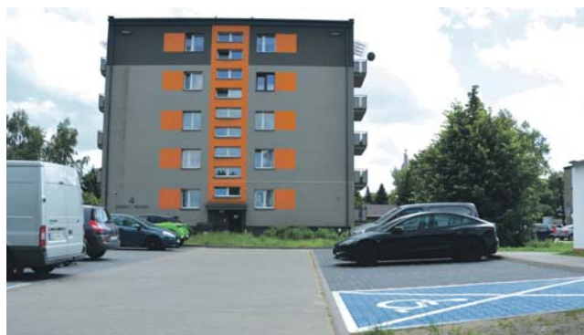
Przy ulicy Żwirki i Wigury na Ksawerze powstał nowy parking.

Trwają modernizacje dróg i chodników oraz budowa miejsc parkingowych w różnych częściach miasta