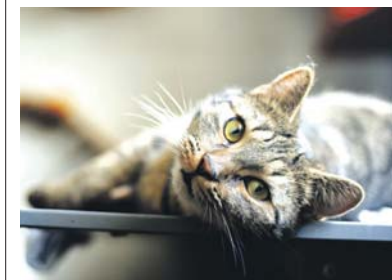
Hot Dog 309/2024 od czerwca ubiegłego roku czeka na domek..