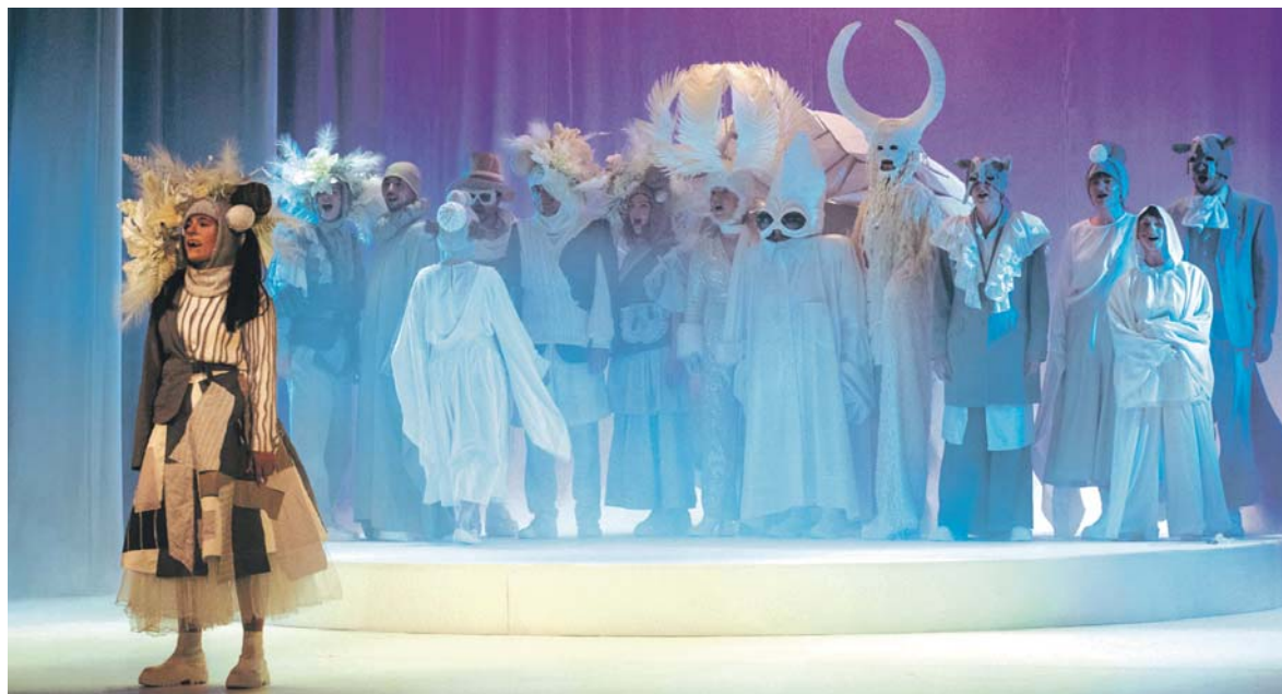
Spektakl „Opowieści z Narnii” naszego teatru otworzył 2. Międzynarodowy Festiwal Teatrów Lalek „Klasyka Od-Nowa”.

Teatr Dormana serdecznie zaprasza do przesyłania zgłoszeń spektakli na 3. Międzynarodowy Festiwal Teatrów Lalek „Klasyka Od-Nowa”. Tegoroczna edycja festiwalu odbędzie się w terminie 7-12 października.