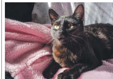
Maślaczek 626/2024 czeka ponad pół roku na swojego człowieka.