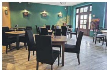
arc. Klubokawiarnia Stacja Arenda