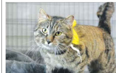
Linda 646/2024 także trafiła do schroniska ponad pół roku temu.

Wiosna w petni, więc już do schronisk zaczynają trafiać niechciane kotki – czasem same, czasem z młodymi mamusiami. Jeśli ktoś może dać takim kocim dzieciom dom, choćby tymczasowy – warto zgłosić się do schroniska. Wszyscy natomiast pamiętajmy, że tylko kastracja i sterylizacja uchronić może setki kocich istnień przed śmiercią, która niestety czeka część bezdomnych zwierząt.