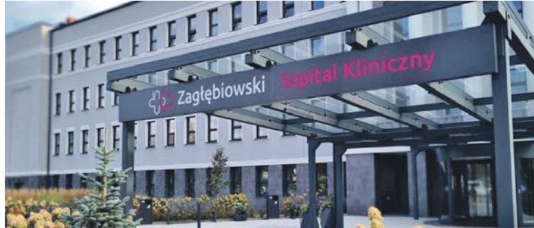
arc Zagłębiowski Szpital Kliniczny w Czeladzi