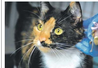
Irminka 701/2024 trafiła do schroniska tuż przed grudniowymi świętami.