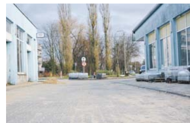
Boczny odcinek ul. Piastowskiej.

■ Remont dróg na terenie miasta Będzina Projektu objął remont odcinków dróg gminnych oraz ciągów komunikacyjnych wraz z poprawą bezpieczeństwa ruchu drogowego. Miasto Będzin zdecydowało się na szeroko zakrojony program remontów i modernizacji dróg. Kwota udzielonej dotacji celowej wynosi 1 509 520,00 zł.