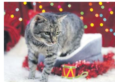
Wojtek czeka na swojego człowieka od 11 października 2024 roku.