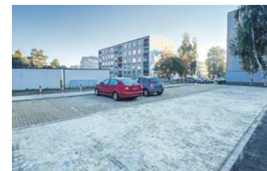
Miejsca postojowe przy ul. Bilika.