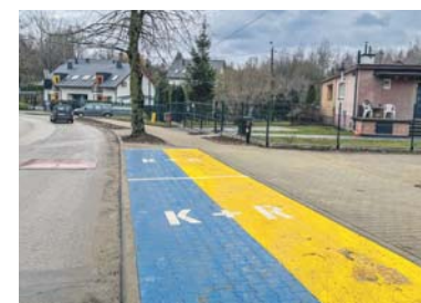
Remont chodnika ul. Krakowska.