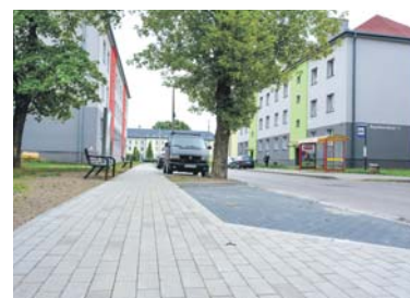
Chodnik przy ul. Szymborskiej.