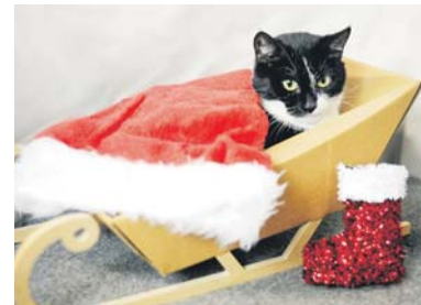
Pistacja czeka w schronisku ponad 10 miesięcy – od 28 lutego 2024.