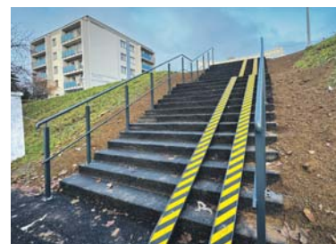
Schody przy ul. Rewolucjonistów.