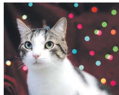
Mitosz wypatruje kochającego właściciela od 7 września 2024 roku.

Wszystkich, którzy dobrze przemyśleli przyjęcie pod swój dach zwierzątka, niezmiennie zachęcamy do adopcji kotów mieszkających w schronisku, domach tymczasowych i Kocięj Chatce, bo na nowych właścicieli czeka ich tam całe mnóstwo!