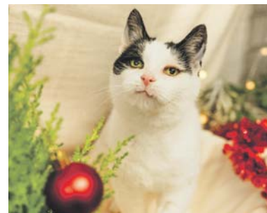
Mułka zamieszkała w schronisku 28 czerwca 2024 roku.