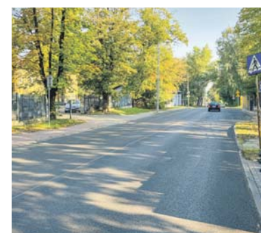
Odcinek ul. Siemońskiej.