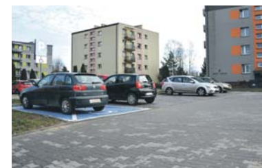
Miejsca postojowe przy ul. Żwirki i Wigury.