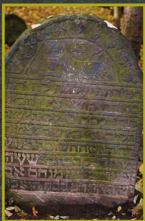
Motywy zdobnicze z będzińskiego cmentarza