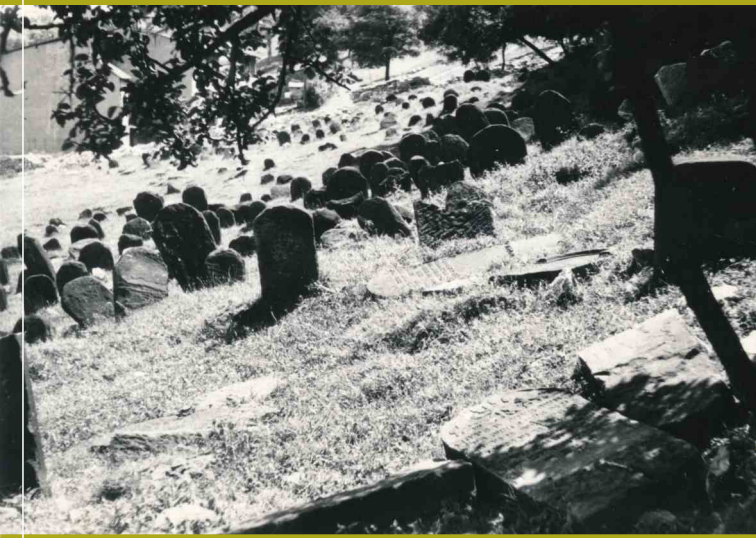
Archiwalne zdjęcie cmentarza na Górze Zamkowej w Będzinie ze zbiorów Muzeum Zagłębia w Będzinie

Cmentarze stanowią znakomite źródło informacji o przeszłości lokalnych społeczności żydowskich. Są to zarówno informacje o poszczególnych zmarłych, jak i pokazujące szersze zjawiska dotyczące całej wspólnoty: wierzenia religijne (zwłaszcza eschatologiczne i mesjańskie), obowiązującą hierarchię wartości, gusty artystyczne czy poziom wykształcenia autorów tekstów i kamieniarzy.