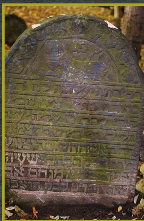
Motywy zdobnicze z będzińskiego cmentarza