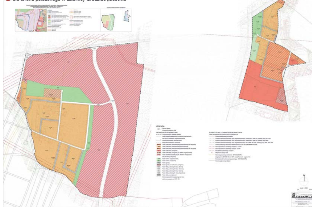
Miejscowy plan zagospodarowania przestrzennego miasta Będzina dla terenu położonego w dzielnicy Grodziec „Osówka”

Uwagi do projektu planu miejscowego mogą być wnoszone w formie papierowej lub elektronicznej, w tym za pomocą środków komunikacji elektronicznej, w szczególności poczty elektronicznej na adres email: rozwoj@um.bedin.pl . Uwagi do prognozy oddziaływania na środowisko mogą być wnoszone w formie pisemnej, ustnie do protokołu lub za pomocą środków komunikacji elektronicznej bez konieczności opatrywania ich kwalifikowanym podpisem elektronicznym, na adres email: rozwoj@um.bedin.pl .