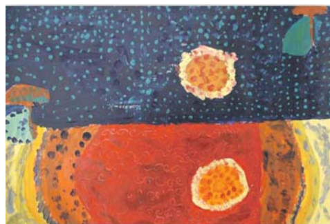
I miejsce – Basia Krakowska lat 9 (Płock)