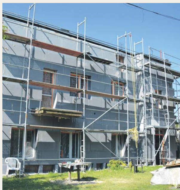
Ulica Gzichowska 34