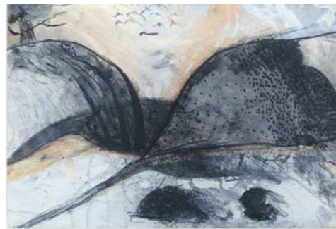
I miejsce – Filip Lipiński lat 10 (Będzin)