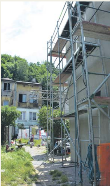
ul. Podzamcze 29