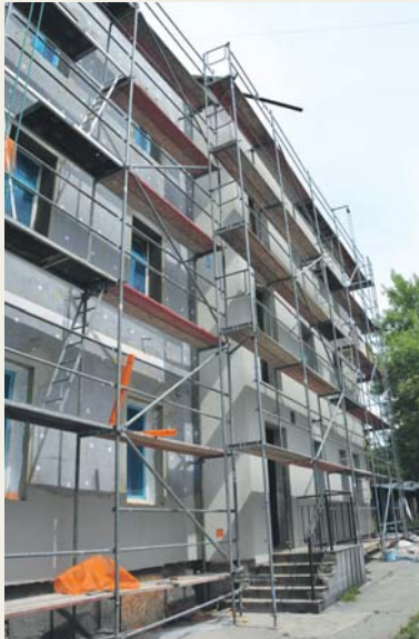
Plac 3 Maja 11