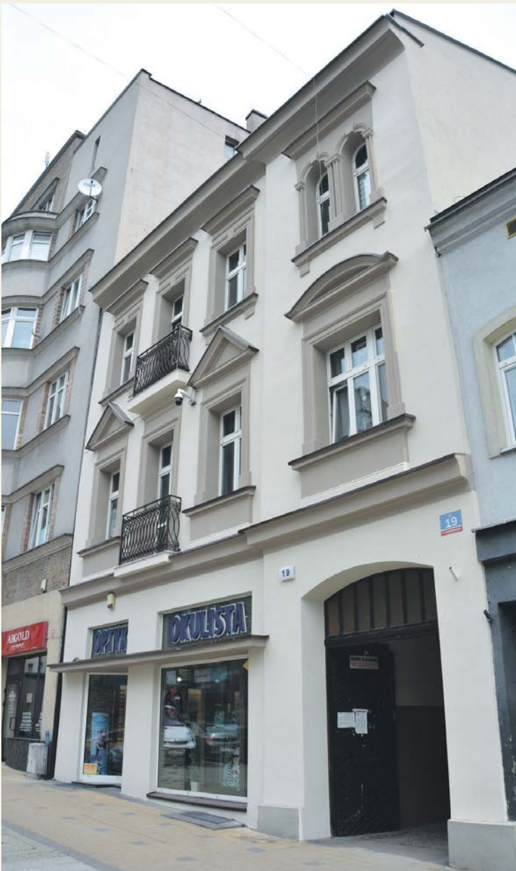
ul. Młotkowskiego 19