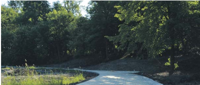
W ramach projektu Zagłębiowskiego Parku Linearnego przy ulicy Krakowskiej powstaje park o tej samej nazwie.

W Przedszkolu Miejskim nr 6 przy ulicy Wistawy Szymborskiej na Ksawerze, trwa kapitalny remont budynku uwzględniający m.in. termomodernizację, wzmocnienie fundamentów i ścian wewnętrznych, modernizację pomieszczeń oraz modernizację łazienek.