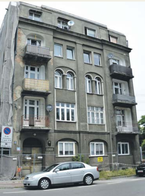
ul. Młotkowskiego 8