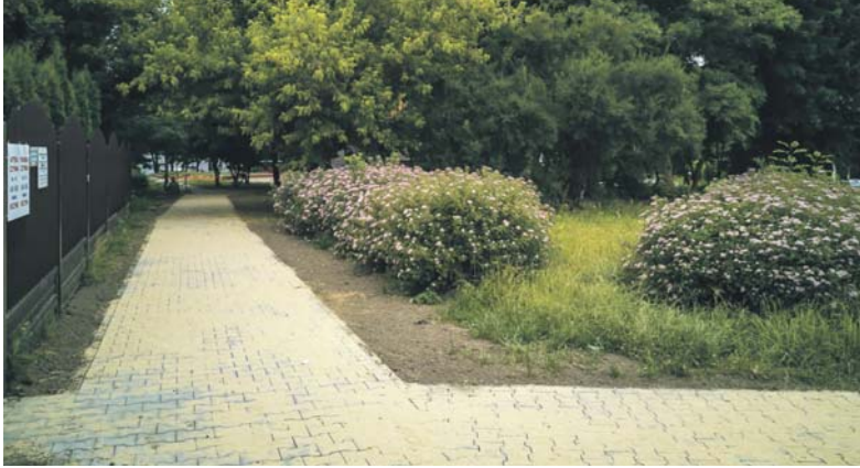
Przy ulicy Stawowej (boczna od Alei Kottątaja), Paryskiej (od budynku Interpromexu do skrzyżowania z Aleją Kottątaja) oraz przy ulicy Andersa na Warpiu powstają nowe chodniki.