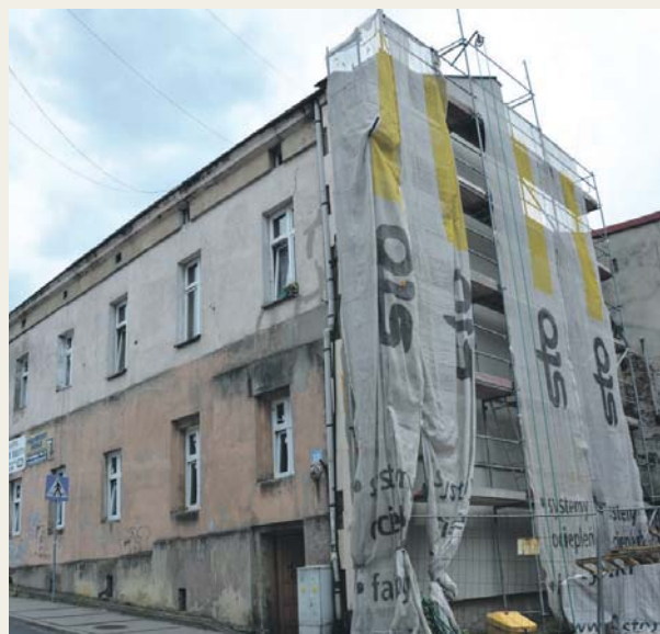
Ulica Modrzejowska 15