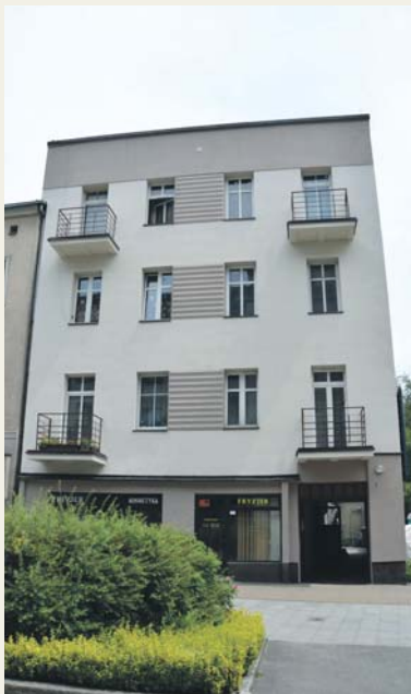
ul. Młotkowskiego 13