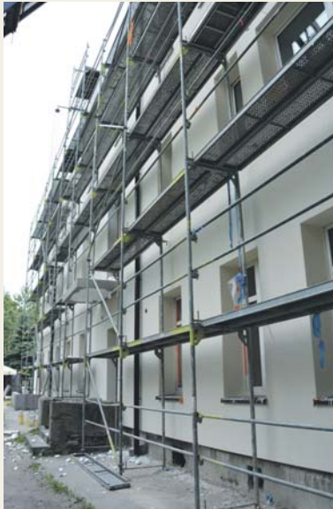
Plac 3 maja 8