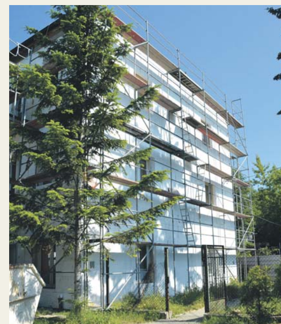
Ulica Grobla 4