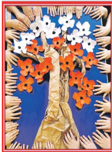
Grupa „Żabki” PM 13 Będzin – „Drzewko marzeń”