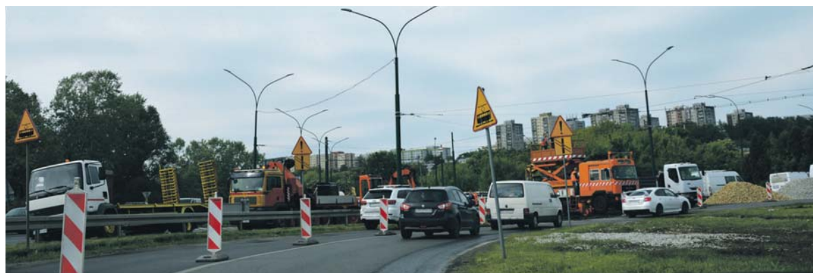
Niełatwy dla mieszkańców remont torowiska dotarł do ronda i niestety musimy doliczyć kilkanaście minut na przejazd przez to miejsce. Na będzińskim fragmencie, oprócz torowiska klasycznego, projekt obejmuje również wykonanie dziewięciu przejść dla pieszych, trzech przejazdów drogowych, dwanaście platform przystankowych oraz przebudowę sieci trakcyjnej na całym odcinku.