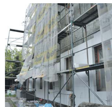
Trwają termomodernizacje kamienicy przy ulicy Grobla 4 w okolicy ronda oraz przy Placu 3 Maja 8 w centrum miasta.