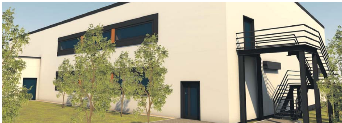
W maju podpisano umowę na przebudowę hali sportowej przy Szkole Podstawowej nr 2 na Zamkowym.