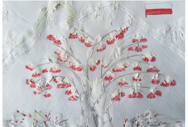
Norbert Pawlik – „Jarzębinowe góry” SP 2 Mierzęcice