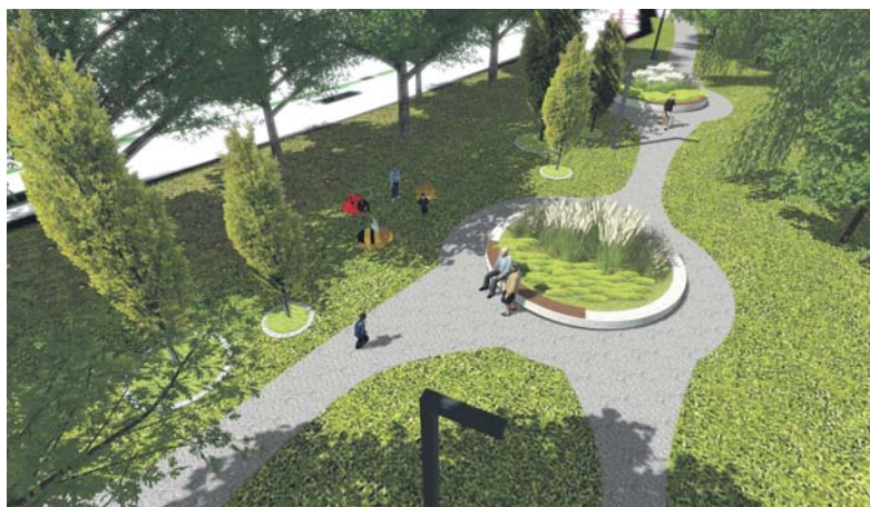
Rewitalizacja bulwarów Czarnej Przemyszy wchodzi w trzeci etap.

Wkrótce rozpoczną się prace na odcinku od ulicy Piłsudskiego w kierunku ulicy Krasickiego – przechodzącym obok budynku biblioteki miejskiej.