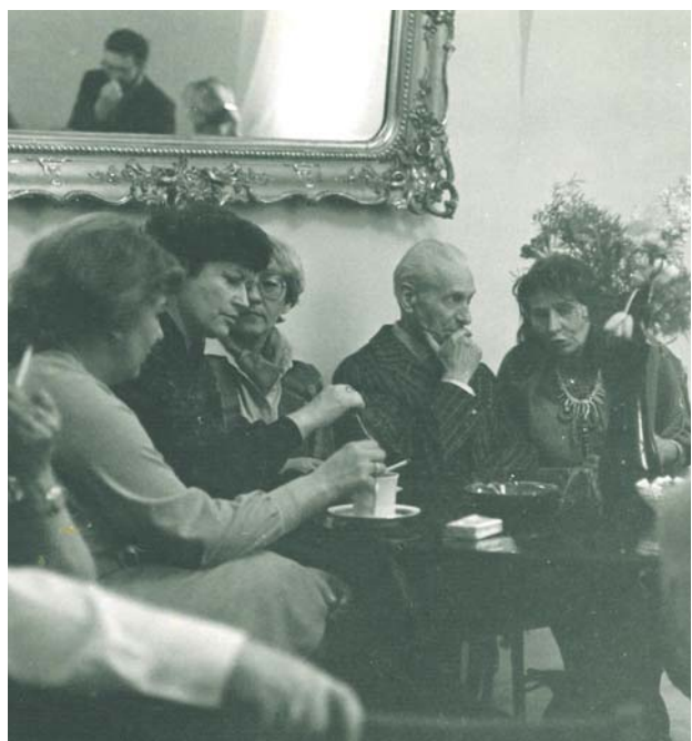
Zaproszeni goście na spotkaniu wieńczącym uroczystości