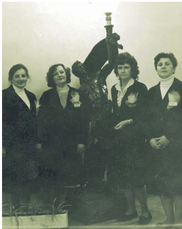
Zdjęcia pamiątkowe pracowników muzeum