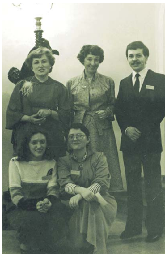
Zdjęcia pamiątkowe pracowników muzeum