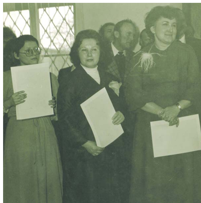
Uchonorowani pracownicy z dyplomami w ręku

Wspomnienia muzealne ze starych fotografii