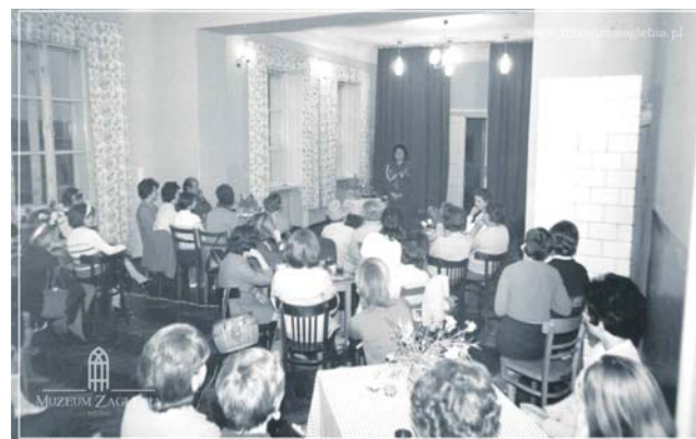
Spotkanie z funkcjonariuszką służb mundurowych.