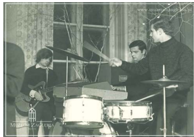
Występ zespołu młodzieżowego w pałacu, lata 60. 70. XX w. (?). Liczymy na pomoc w poznaniu nazwy zespołu. A może ktoś się rozpoznaje – prosimy o kontakt.