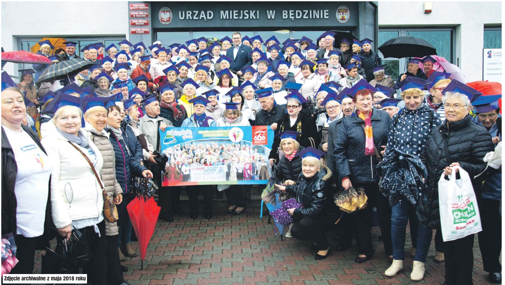
Zdjęcie archiwalne z maja 2018 roku