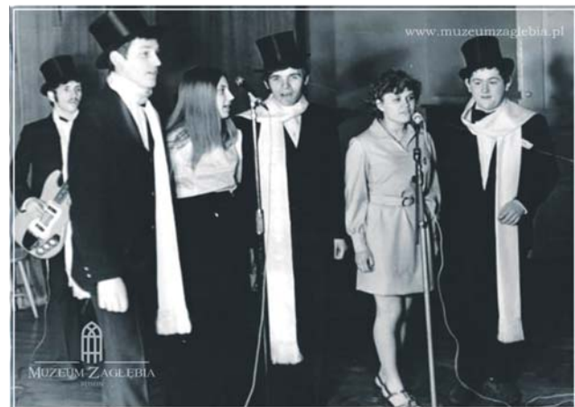
Występ w pałacu zespołu młodzieżowego, a może grupy recytatorskiej (?), lata 60. 70. XX w. (?). Liczymy na pomoc w ustaleniu imion wspaniałej młodzieży.

Po przypadkowym odkryciu w salach pałacowych cennych malowideł ukrytych pod warstwami XIX i XX wiecznych narzutów tynku Konserwator Wojewódzki podjął decyzję o rozpoczęciu prac konserwatorskich i w II połowie lat 70. działalność Domu Kultury została