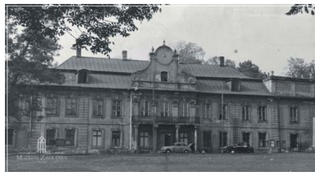
Pałac pod zarządem Państwowego Ośrodka Maszynowego, lata 50. XX w., ze zbiorów Muzeum Zagłębia w Będzinie.

zakończona. Konserwację polichromii z równocześnie prowadzonymi pracami remontowymi pałacu trwały wiele lat. W międzyczasie zostały wszczęte procedury dotyczące zmiany funkcji zabytkowego obiektu z Młodzieżowego Domu Kultury na placówkę muzealną – o czym Państwu opowiemy w następnym odcinku.