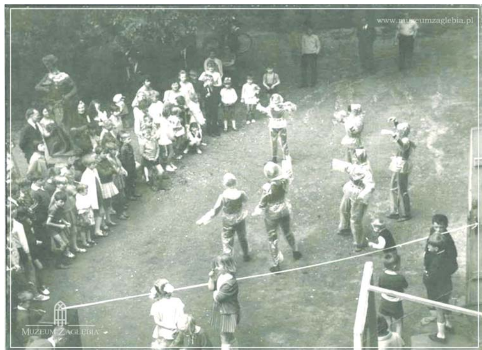
Zabawa plenerowa. Za publicznością widoczny posąg Bachusa, lata 60. 70. XX w.