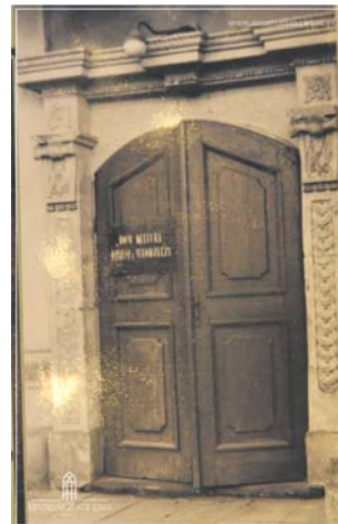
Drzwi z tablicą informującą o funkcji obiektu, lata 60. XX w., ze zbiorów Muzeum Zagłębia w Będzinie.

Szanowni Państwo, jeżeli ktoś posiada wspomnienia związane z pałacem z tamtych lat i chciałby uzupełnić naszą opowieść zapraszamy do kontaktu: 32 267 77 07, wew. 26 lub mhalasik@muzeum-zaglebia.pl Bardzo liczymy na współpracę w sprawie fotografii upamiętniających tamten czas.