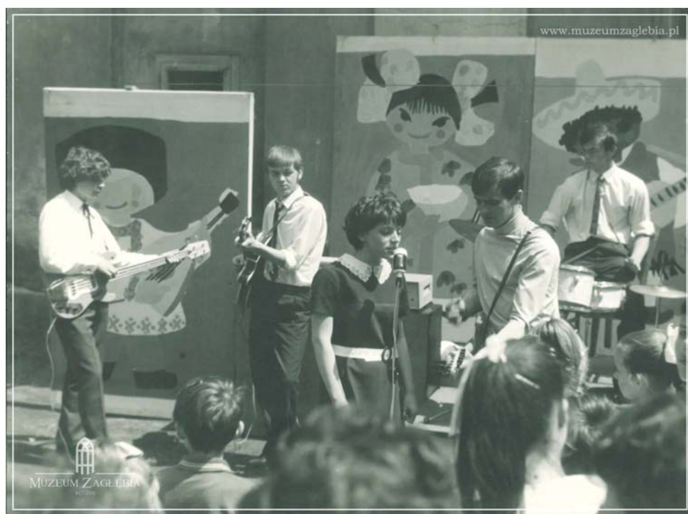
Występ zespołu młodzieżowego za pałacem, lata 60. 70. XX w. (?), ze zbiorów Muzeum Zagłębia w Będzinie. Liczymy na pomoc w poznaniu nazwy zespołu.

Na początku 1957 r. udało się doprowadzić do wysiedlenia dotychczasowego gospodarza i rozpocząć prace remontowe. Na szczęblu wojewódzkim zapadła decyzja o przekształceniu obiektu w Młodzieżowy Dom Kultury. Założenia dotyczące remontu przewidywały dostosowanie poszczególnych wnętrz pałacowych do wymogów Wydziału Oświaty, tak aby młodzież po godzinach szkolnych spędzała aktywnie czas w różnych pracowniach. Koncepcję „rewitalizacji” parku i ogrodu przedstawił ówczesny kierownik Wydziału Oświaty – Pan Łętka. Miały tam się znaleźć boiska do gier i zabaw, a ogród chciano zmienić w ambitne laboratorium różnorodnych gatunków roślin, drzew i krzewów pochodzących z terenów całej Polski. Plany zakładały powierzenie młodzieży opieki nad hodowlą królików, nutrii, rasowych kur, a także pszczoł. Plony pozyskane z sadu i ogrodu warzywnego młodzi