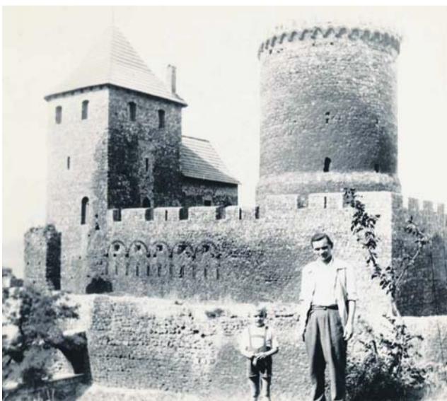
Widok zamku od północnego wschodu, koniec lat 50. XX w.

W tamtym okresie będzński zamek wzbudzał zainteresowanie nie tylko szerokiej publiczności, ale też był natchnieniem dla fil-