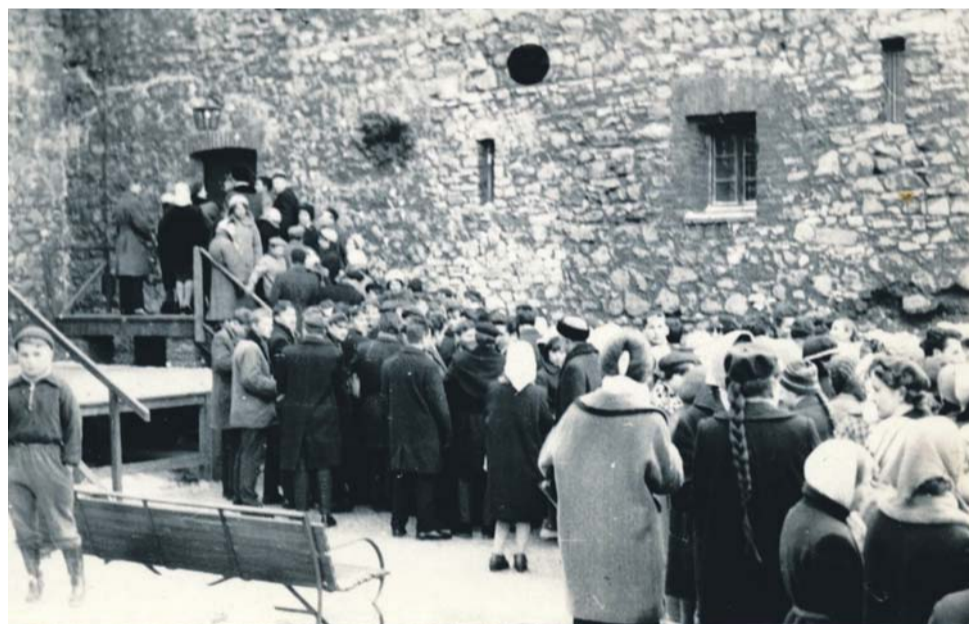
Kolejka oczekujących na otwarcie muzeum, koniec lat 50. XX w.

w skali ich regionów. Wizyta w Będzinie muzealników, o tak wysokiej randze, była pokłosiem tzw. Międzynarodowej Kampanii Muzealnej, czyli spotkania w Polsce muzeologów z krajów ówczesnej Europy, które odbyło się we wrześniu 1956 roku. Celem zjazdu m.in. kustoszy z Luwru, dyrekcji muzeów w Pradze, Budapesztu, Sofii była wymiana poglądów na tematy zawodowe na przykładzie wybranych muzeów Warszawy, Krakowa, Poznania, Torunia i Gdańska, natomiast w centrum dyskusji znalazło się też Muzeum w Będzinie.