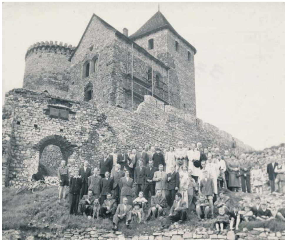
Wycieczka, 1955 r.