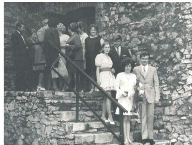
Państwo Młodzi, świadkowie i goście weselni na dziedzińcu zamkowym, 1972 r.