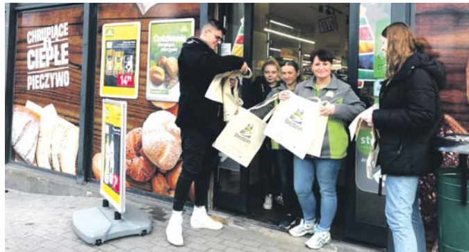
Eko-torby pod będzińskimi marketami. Akcja rozdawania toreb ekologicznych, która odbyła się 23 stycznia pod będzińskimi marketami, cieszyła się ogromnym zainteresowaniem mieszkańców. Będzinianie praktykując ekologiczne zachowania chętnie odbierali płócienną torbę wielokrotnego użytku, aby w ten sposób ograniczyć zużycie plastikowych reklamówek, które bardzo negatywnie wpływają na środowisko.

Kampania Edukacyjno-Ekologiczna realizowana jest w ramach Projektu pn.: Zagłębiowski Park Linearny – rewitalizacja obszaru funkcjonalnego doliny Przemyszy i Brynicy – Miasto Będzin współfinansowanego ze środków Unii Europejskiej w ramach Regionalnego Programu Operacyjnego dla Województwa Śląskiego na lata 2014 – 2020 Działanie 5.4.3. Ochrona różnorodności biologicznej – tryb pozakonkursowy.