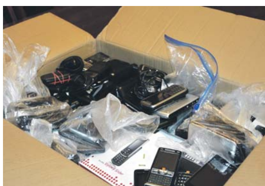
Ekophone. Ładowarka solarna za zużyte telefony. 27 stycznia w urzędzie miejskim odbyła się Akcja Ekophone polegająca na oddaniu zużytych telefonów komórkowych. Uczestnicy akcji, którzy licznie przybyli na miejsce zbiórki udowodnili, że dobro środowiska naturalnego jest dla nich ważną kwestią. Bezużyteczne telefony komórkowe stanowią ogromne zagrożenie dla otaczającego środowiska naturalnego, ponieważ zawierają metale ciężkie takie jak kadm i ołów. Wyrzucony telefon może zatruć znaczne ilości gleby lub wody. W nagrodę za ekologiczną postawę właściciele telefonów otrzymali ładowarkę solarną.