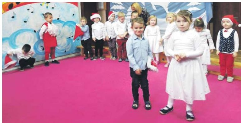
Jasełka organizowane przez grodzieckie Przedszkole Miejskie nr 15.