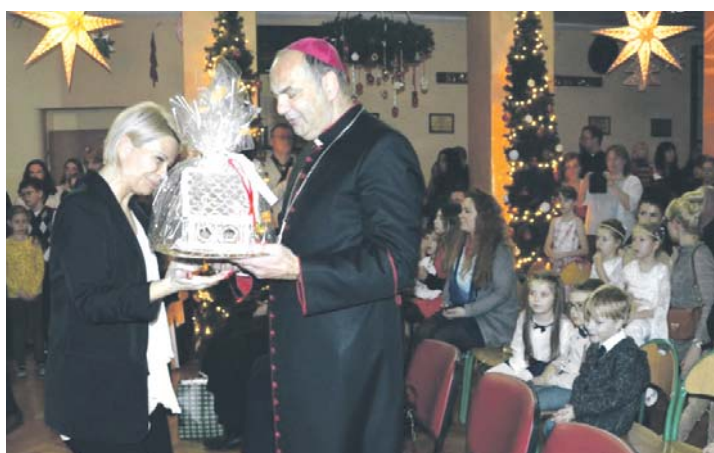
Wigilia środowiskowa w Szkole Podstawowej nr 4 na Ksawerze.