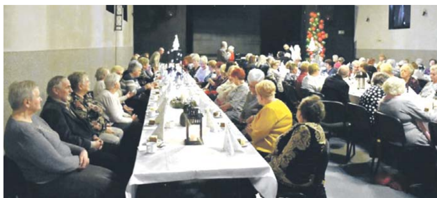
Spotkanie wigilijne Polskiego Związku Emerytów, Rencistów i Inwalidów w filii Ośrodka Kultury.