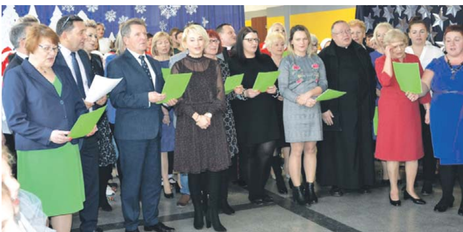
Wspólne kolędowanie podczas jasełek w Szkole Podstawowej nr 8 na Warpiu.