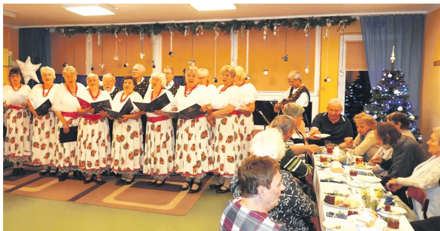
Jubileuszowa dwudziesta „Wigilia dla samotnych” w Przedszkolu Miejskim na 5 na Syberce.