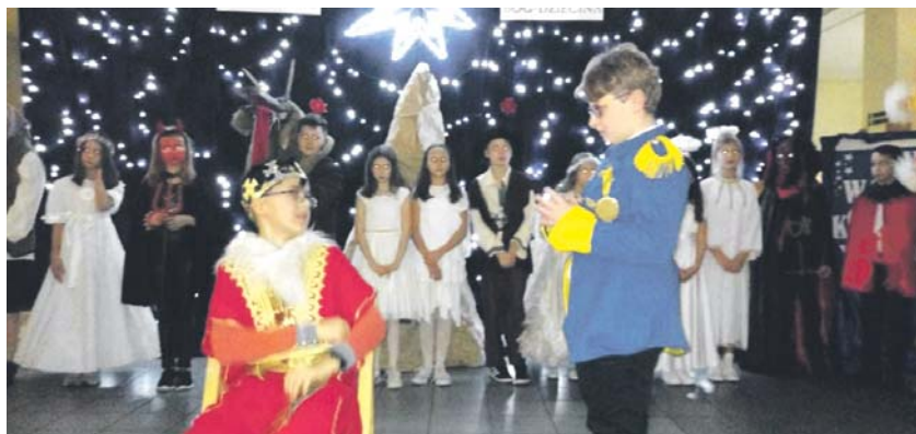
Jasełka w Szkole Podstawowej nr 3 w Grodźcu.