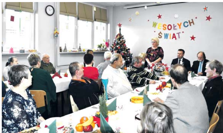
Spotkanie wigilijne w będzińskim Centrum Usług Społecznych przy ulicy Sienkiewicza.