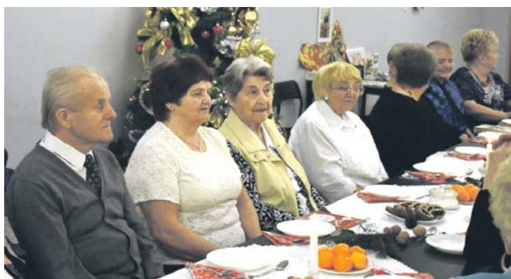
Spotkanie z seniorami w Klubie Relax.