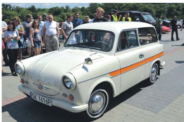
Wyróżnienie otrzymał Trabant 600 Kombi z 1963 roku.