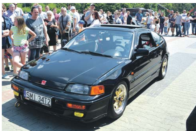
Trzecie miejsce w głosowaniu zajęła Honda CRX ED9 z 1991 roku.