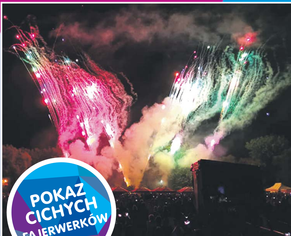
POKAZ CICHYCH FAJERWERKÓW