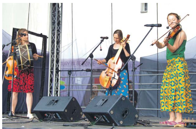
Za nami najkrótsza noc w roku, czyli Noc Świętojańska. Na wszystkich, którzy w sobotę 22 czerwca pojawili się na wzgórzu zamkowym, czekał pokaz kobiety fakira, pokaz iluzji, warsztaty tkackie, koncert zespołu Sutari oraz teatr ognia Los Fuegos.