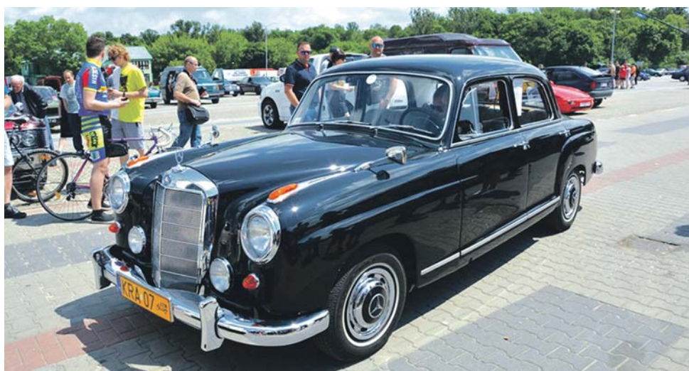
Tytuł Samochodu Miesiąca otrzymał Mercedes z 1958 roku