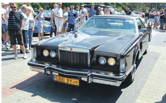
Drugie miejsce w głosowaniu zajął Lincoln Mark V z 1978 roku