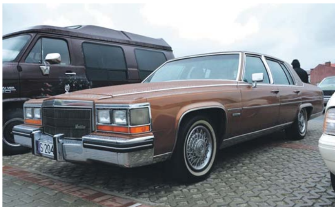
Trzecie miejsce w głosowaniu zajął Cadillac Fleetwood Brougham z 1983 roku.