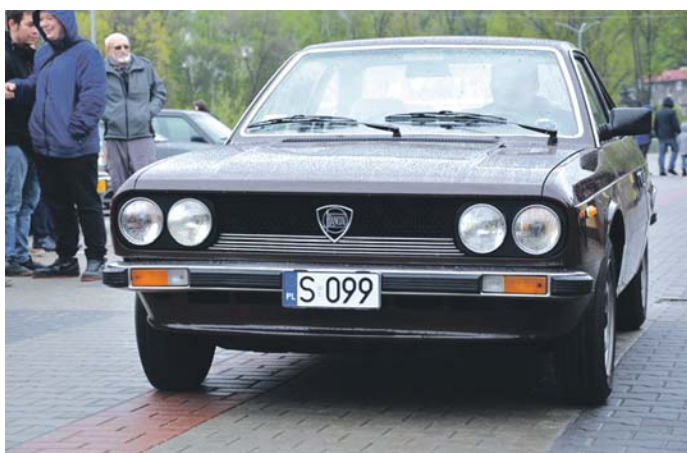
Wyróżnienie od organizatorów oraz bon paliwowy od władz Będzina otrzymała Lancia Beta 1300 Coupe z 1979 roku.