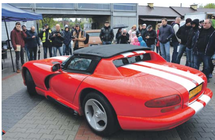
Tytuł Samochodu Miesiąca otrzymał Dodge Viper RT10 z 1994 roku.

Natomiast już 2 czerwca kolejna Klasyczna Niedziela – jak zawsze w okolicach Dnia Dziecka poświęcona dzieciakom. Dla wszystkich pociech szykuje się szereg atrakcji: pokazy strażackie w specjalnie przygotowanym miasteczku, pokazy pierwszej pomocy oraz militaria, a dla dzieciaków ze Specjalnego Ośrodka Szkolno-Wychowawczego w Będzinie (SOSW Będzin) jak co roku przeprowadzona zostanie zbiórka – wszystkie pieniądze, które w czasie zlotu zebrane zostaną do specjalnej skarbonki, trafią właśnie do wychowanków tego ośrodka – na małe przyjemności i bieżące potrzeby. Liczymy na wsparcie! Oczywiście podczas zlotu odbędzie się głosowanie na Samochód Miesiąca, a także wręczymy nagrodę organizatorów dla najładniejszego, najbardziej wyjątkowego i oryginalnego, najbardziej dopracowanego klasyka naszym zdaniem. Spotykamy się jak zawsze na Targowisku w Będzinie o godzinie 9:00. Przy okazji można też zajrzeć na Będziński Targ Staroci.