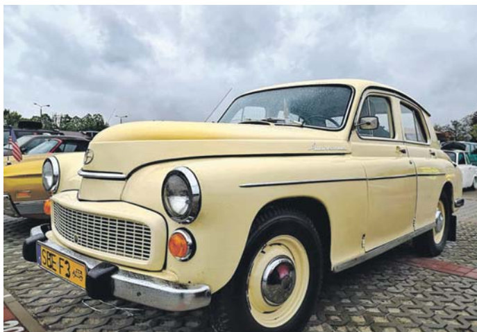
Drugie miejsce w głosowaniu zajęła Warszawa 204 z 1965 roku.