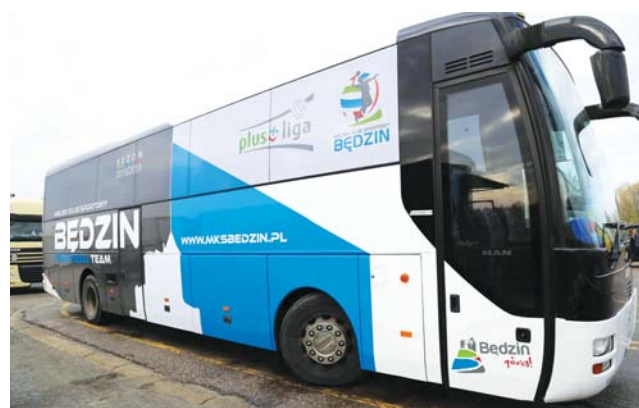
Oto nowa odsłona klubowego autokaru, którym 2 listopada nasi siatkarze udali się na zwycięski mecz z Asseco Resovią Rzeszów.