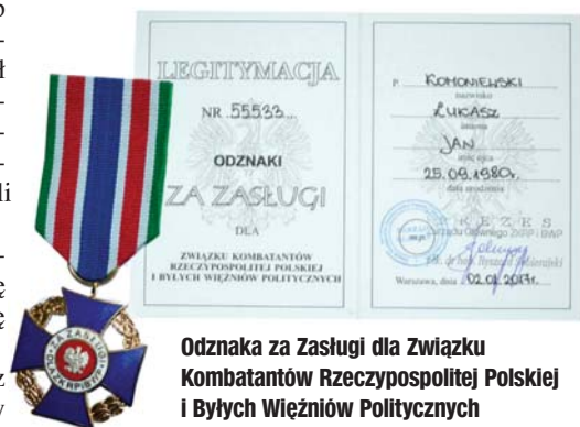
Odznaka za Zasługi dla Związku Kombatanów Rzeczypospolitej Polskiej i Byłych Więźniów Politycznych

Podjęto także m.in. uchwały w sprawach: 1/ określenia wysokości opłaty za korzystanie z wychowania przedszkolnego w wieku do lat 5 w prowadzonych przez Miasto Będzin przedszkolach i oddziałach przedszkolnych w szkołach podstawowych, 2/ projektu dostosowania szkół podstawowych i gimnazjów do nowego ustroju szkolnego oraz projektu zmiany uchwały Rady Miejskiej w Będzinie z dnia 2 marca 2009 roku w sprawie ustalenia sieci prowadzonych przez miasto Będzin publicznych przedszkoli i oddziałów przedszkolnych w szkołach podstawowych, 3/ wyrażenia zgody na zawarcie porozumienia pomiędzy Gminą Będzin a Gminą Sosnowiec w sprawie powierzenia Gminie So-