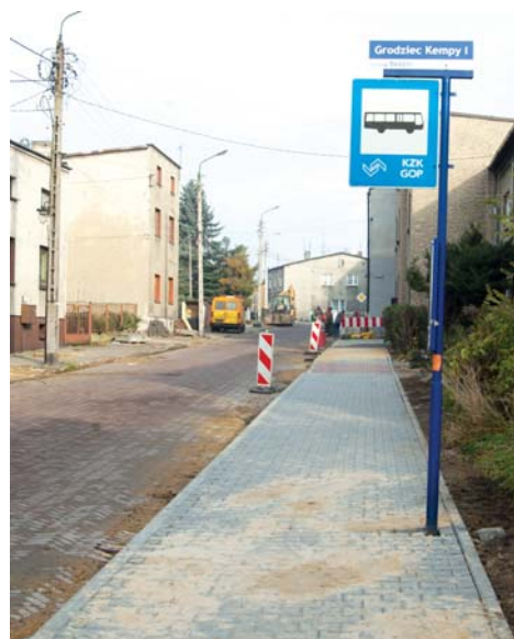
Rozpoczął się 2. etap prac na ulicy Kempy i ulicy Torowej. Prowadzone roboty ziemne są już na ukończeniu, dzięki temu mogły rozpocząć się prace związane z wymianą nawierzchni chodników. Kolejnym etapem będzie położenie nowej nawierzchni jezdni.