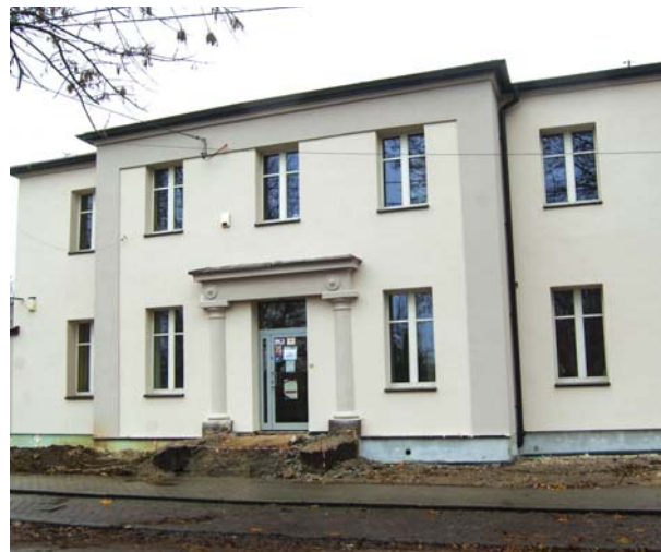
Do końca zbliża się termomodernizacja siedziby Miejskiego Zakładu Budynków Mieszkalnych przy ulicy Krakowskiej 16.