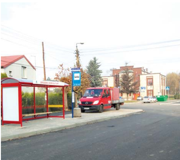
Nowa nawierzchnia jezdni oraz chodniki powstają przy ulicy Róży Luksemburg oraz na odcinkach ul. Kołłątaja, Różyckiego i Słowackiego. W okolicach filii Ośrodka Kultury zamontowano nowe wiaty przystankowe.