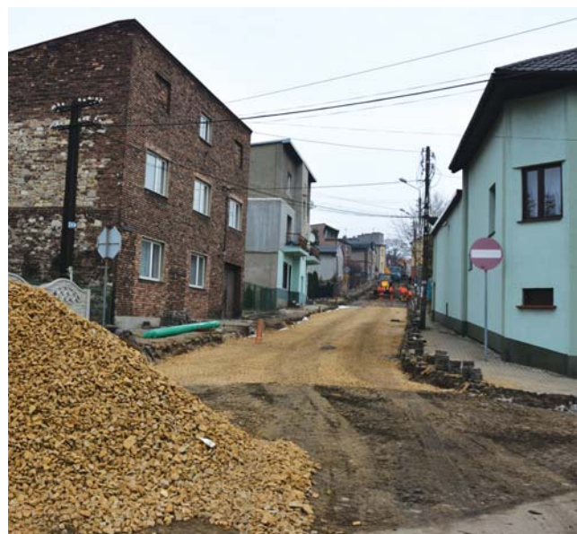
Przy ulicy Limanowskiego trwa przygotowywanie terenu pod wylanie asfaltu.