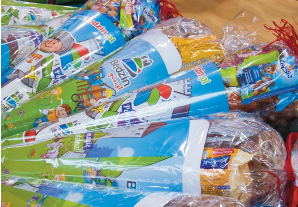
Każdy uczeń otrzymał słodkie co nieco na dobry początek nauki!