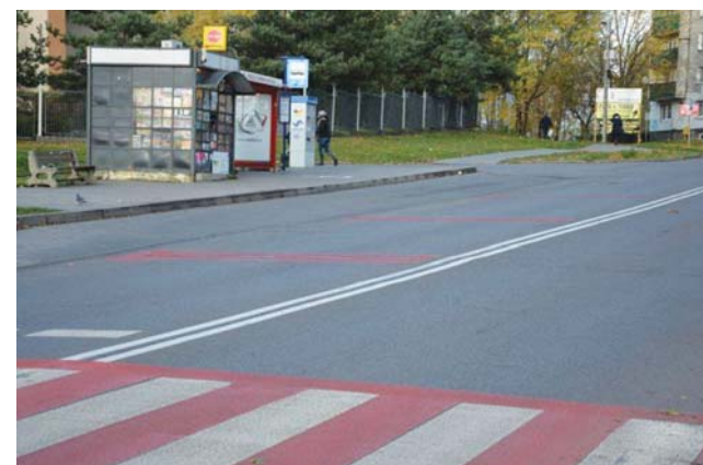
Mając na uwadze bezpieczeństwo mieszkańców, na ulicy Chmielewskiego w rejonie przejścia dla pieszych zostały zamontowane tzw. linie vibracyjne, które informują kierowców o zbliżaniu się do miejsca szczególnie niebezpiecznego i mają spowodować zmniejszenie prędkości nadjeżdżających pojazdów.