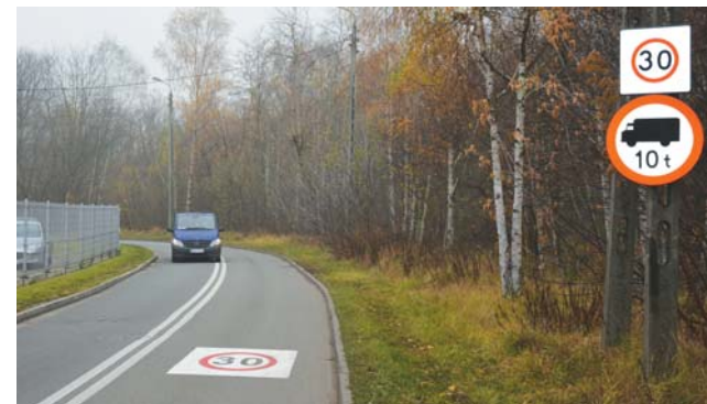
Wprowadzono ograniczenie prędkości do 30 km/h dla kierowców poruszających się po ulicy Brzozowickiej od skrzyżowania z ul. Świerczewskiego aż do osiedla Brzozowica.