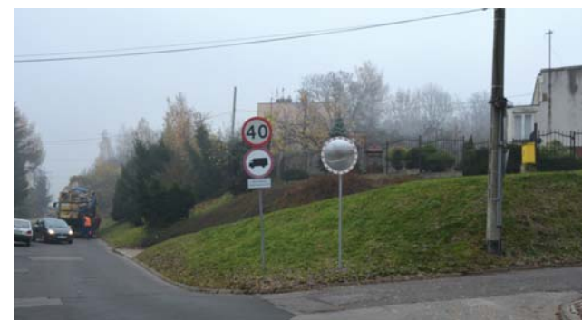
Zamontowany został znak typu lustro na skrzyżowaniu ulic Szybowej i 27 stycznia, który poprawi bezpieczeństwo zarówno pieszych jak i kierowców poruszających się w tym rejonie.