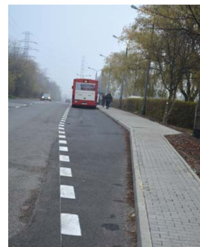
Właśnie zakończyły się prace związane z modernizacją zatoki autobusowej przy Wojewódzkim Szpitalu Specjalistycznym nr 5 im. św. Barbary. Dzięki inwestycji autobusy, które oczekują na rozpoczęcie kursu, nie utrudniają ruchu pozostałym użytkownikom drogi.