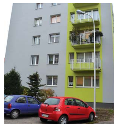
Przy ulicy Gawlika w Będzinie zainstalowano nowe lampy oświetlenia ulicznego, które z pewnością poprawią komfort i bezpieczeństwo mieszkańców. Kolejne lampy przy tej ulicy będą sukcesywnie wymieniane.