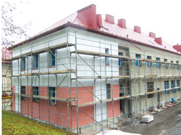
Przy ulicy Stalickiego 4 trwają prace związane z termomodernizacją budynku, w ramach których zostanie wykonane docieplenie obiektu wraz z wymianą stolarki okiennej.